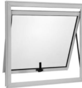
Figura 5 – Janela maxim-ar de alumínio com uma folha de vidro