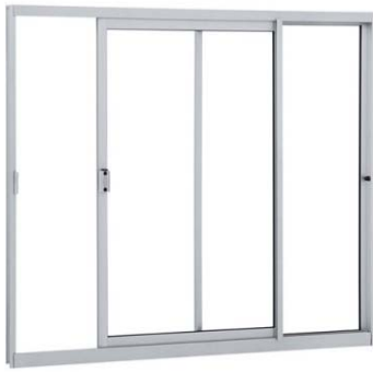
Figura 2 – Janela de correr de alumínio com duas folhas de vidro