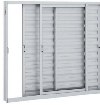
Figura 3 – Janela de correr de alumínio com três folhas com veneziana