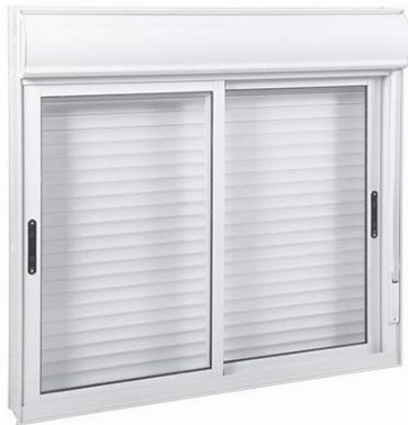
Figura 4 – Janela de correr de alumínio com duas folhas de vidro e persiana integrada