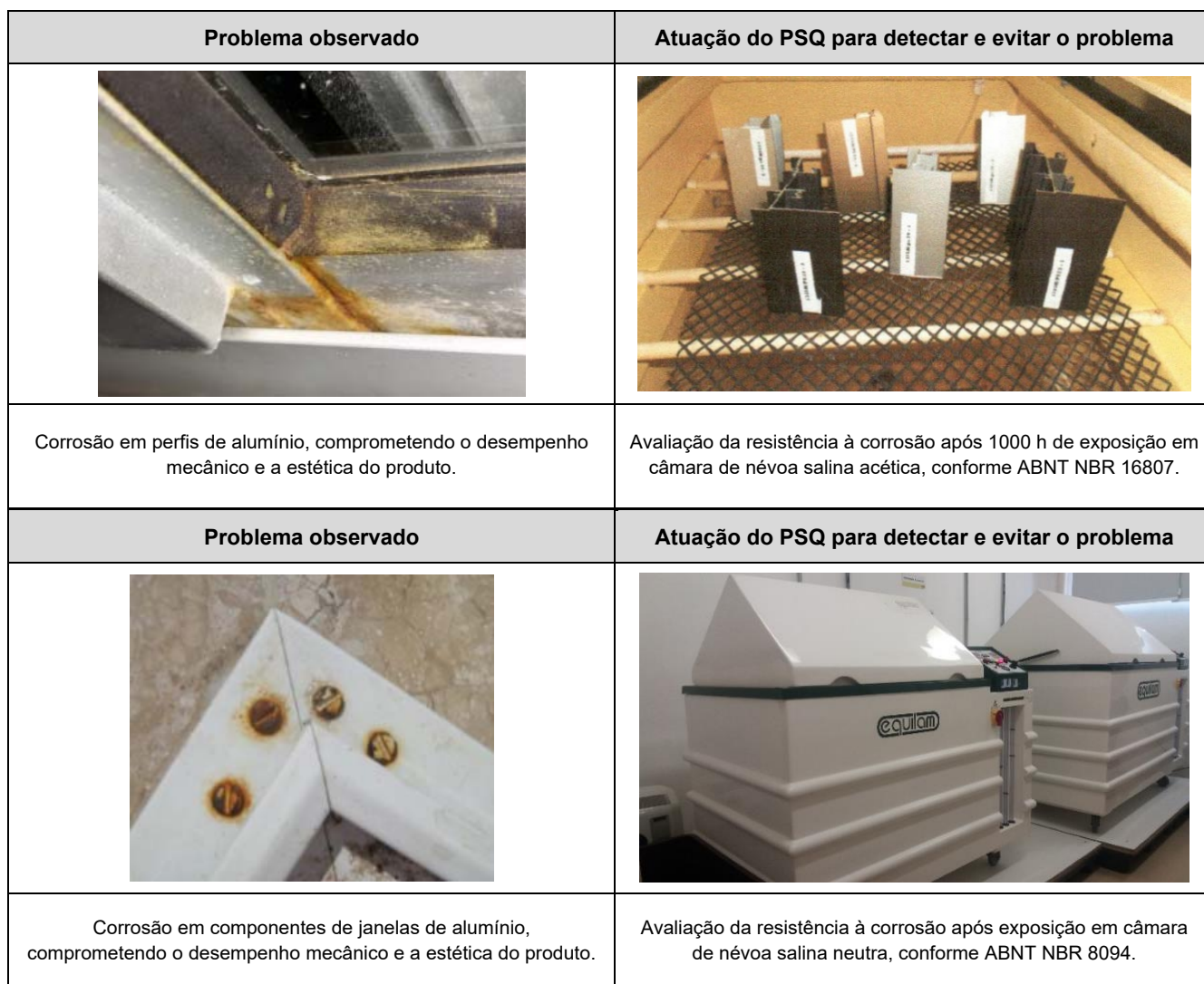
Tabela 2 – Principais manifestações patológicas em portas e janelas de alumínio e atuação do PSQ

As portas e janelas de alumínio que não atendem às exigências normativas poderão apresentar manifestações patológicas. Para evitar tais problemas, o PSQ atua na avaliação da janela e de seus componentes produzidos pelas empresas participantes. A Tabela 2 apresenta as principais manifestações patológicas e a atuação do PSQ.