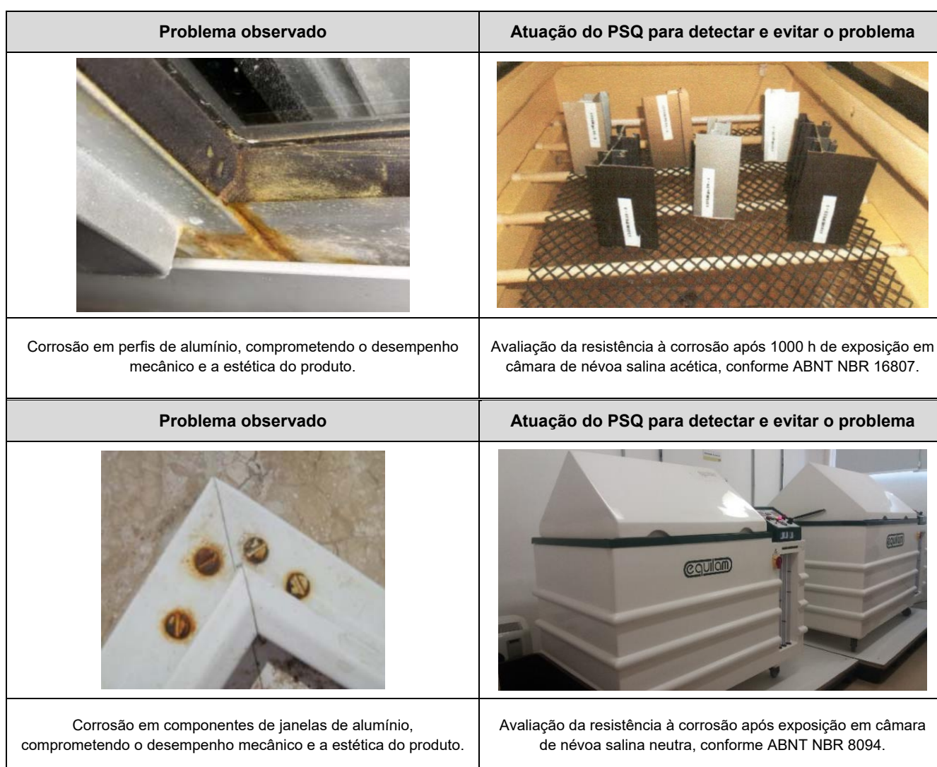
Tabela 2 – Principais manifestações patológicas em portas e janelas de alumínio e atuação do PSQ

As portas e janelas de alumínio que não atendem às exigências normativas poderão apresentar manifestações patológicas. Para evitar tais problemas, o PSQ atua na avaliação da janela e de seus componentes produzidos pelas empresas participantes. A Tabela 2 apresenta as principais manifestações patológicas e a atuação do PSQ.