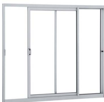
Figura 2 – Janela de correr de alumínio com duas folhas de vidro

As Figuras 2, 3, 4 e 5 ilustram, respectivamente, uma janela de correr de alumínio com duas folhas de vidro, uma janela de correr de alumínio com três folhas com veneziana, uma janela de correr de alumínio com duas folhas de vidro e persiana integrada e uma janela maxim-ar de alumínio com uma folha de vidro.